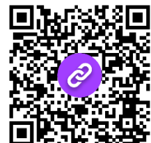
Abbildung 1: Link zur Anmeldung